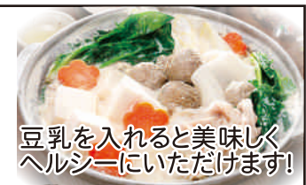
豆乳を入れると美味しくヘルシーにいただけます!